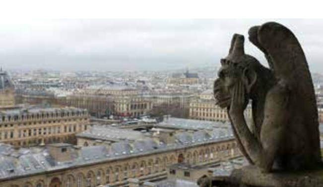
Frankreich Paris, Notre Dame

Die Erstellung der Broschüre wurde aus Erasmus+ Mitteln der EU gefördert..